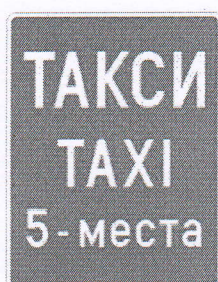
Пътен знак E20

Да бъдат обозначени всички таксиметрови стоянки с пътен знак E20, B27, Допълнителна табела T18.1 и където е нужно с Допълнителна табела T10, като табелата оказваща часовете на стоянката да е под знак E20.