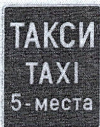
Пътен знак E20

Да бъдат обозначени всички таксиметрови стоянки с пътен знак E20, B27, Допълнителна табела T18.1 и където е нужно с Допълнителна табела T10, като табелата оказваща часовете на стоянката да е под знак E20.