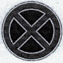
Пътен знак B27